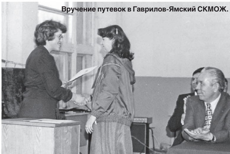
Вручение путевок в Гаврилов-Ямский СКМОЖ.

Чем дальше уходит наша молодость, тем больше и грустнее воспоминания. Жаль, что больше никогда мы не вернемся в ту беззаботную пору. А пора была действительно удивительная, и складывалось все вроде бы удачно.