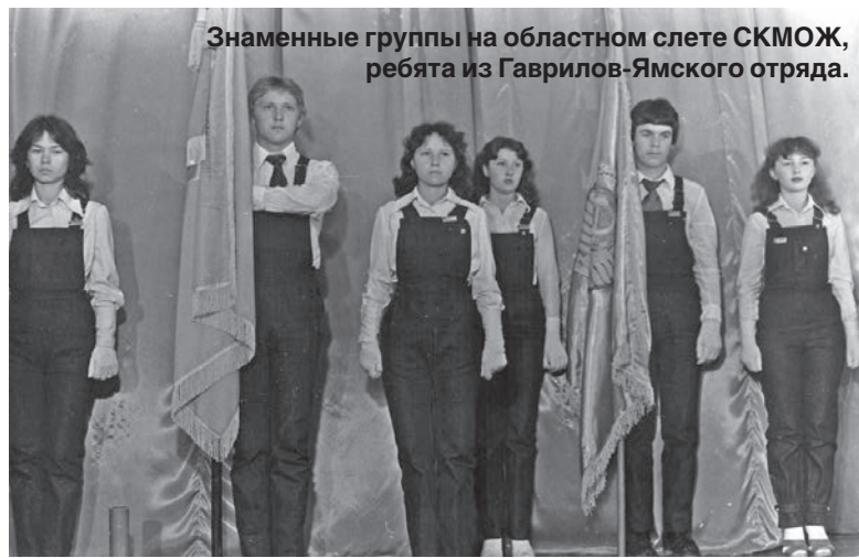
Знаменные группы на областном слете СКМОЖ, ребята из Гаврилов-Ямского отряда.

У меня уже был сформирован первый класс, и работать мне хотелось как молодому специалисту в школе с детьми. До конца второй лагерной смены велись уговоры-переговоры, а потом строго сказали: "Хочешь работать в школе? Пожалуйста! Их у тебя будет 20-ть. Тебе нужны дети - их будет целый район: и маленьких, и больших, и пионеров, и комсомоль-