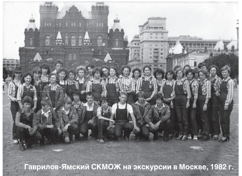
Гаврилов-Ямский СКМОЖ на экскурсии в Москве, 1982 г.

Но перед тем, как отправиться к месту дислокации, ребята прошли обучение основам и приемам животноводства в опытно-производственном хозяйстве села Михайловское, а юноши осваивали основы вождения машин и тракторов в "Сельхозтехнике". Потом со-